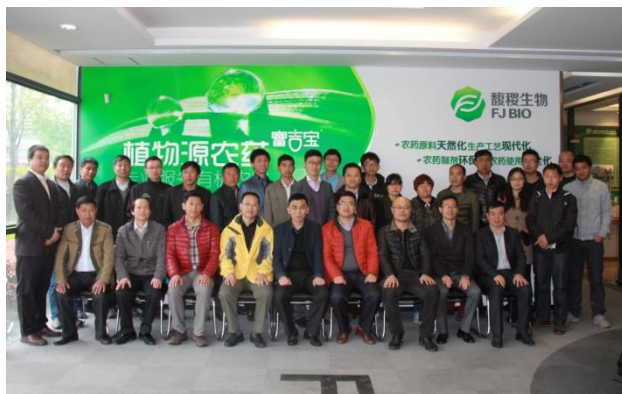
图为培训班全体人员。

3月30日，有机蔬菜专业委员会成立会议后不久委员会举办活动，上海地区二十余家有机农业生产的同行们又聚集一堂，共同参加我协会有机蔬菜专业委员会和我协会会员单位馥稷生物共同举行“有机农业生产技术交流会”。