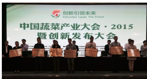
图中间为我协会副会长单位上海弘阳农产品有限公司被授予 4 星铜牌的企业。

为推动产业创新、引领蔬菜产业升级，中国蔬菜协会于 2015 年 5 月 15-16 日在石家庄召开中国蔬菜产业大会暨创新发布大会，会上有关领导和专家就我国蔬菜产业现状及发展趋势、我国农业发展形势及对策等问题作了探讨。会上宣布了我协会副会长单位上海弘阳农产品有限公司等全国 18 家企业获得第二批优秀蔬菜生产商，并进行了授牌仪式。我协会孙占刚副秘书长参加了会议。