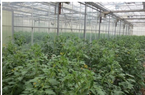
图为种都种业种子基地