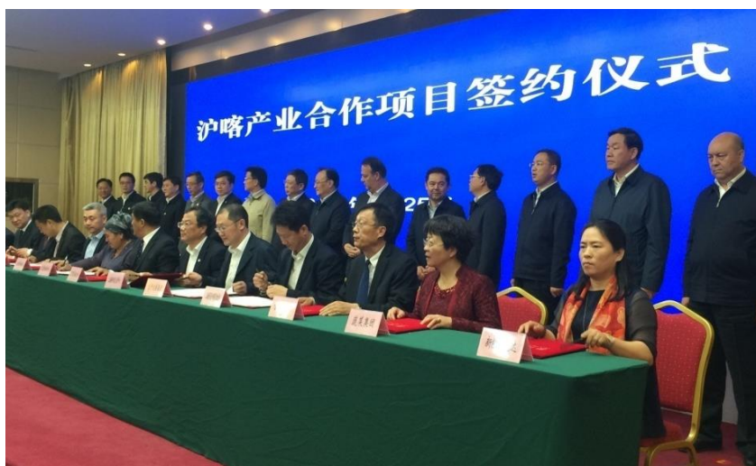
图：站排中为上海市杨雄市长，坐排右四我协会吴梦秋会长、右一我协会任长艳理事。

4月25日，上海市委副书记、市长杨雄率领的上海市代表团在新疆维吾尔自治区党委副书记、自治区主席雪克来提·扎克尔陪同下，在新疆喀什地区考察并推进落实产业援疆促