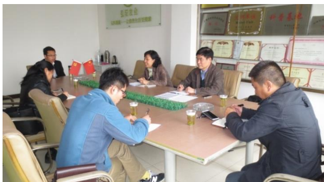
图为在弘阳农业调研。