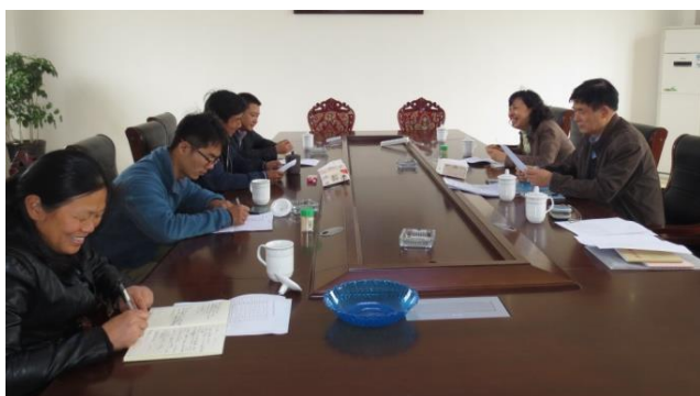
图为在世鑫输蔬果种植合作社调研

2013年8月，市政府沪府[2013]61号文中发布了本市对征地青苗（蔬菜）和食用菌补偿标准，近3年过去了，今年4月15日，市有关单位召开会议，要对部分征地青苗费补偿标准等进行适当调整，希望相关行业协会提出建议，由于关系菜农的切身利益，本行业协会十分重视，在市农委蔬菜办和种植业办的指导下，进行了一系列调查研究，如查阅统计资料，走访相关部门，听取专家意见，并实地调研了部分蔬菜种植企业和食用菌种植部门，对几大类蔬菜品种的征地青苗补偿费和多个食用菌品种的征地补偿费提出了建议，已于4月底上报给市有关单位，供其调整时作参考。