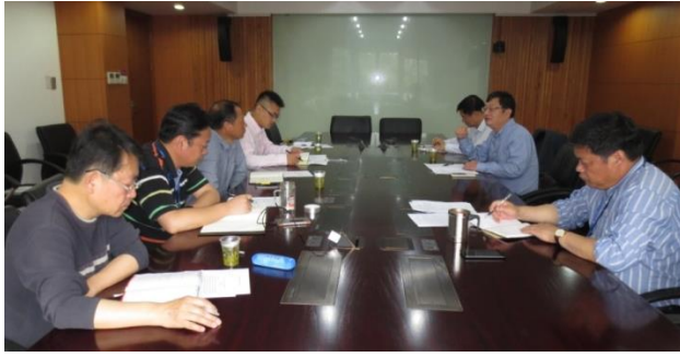
图为 5 月 5 日农业生产资料市场调研启动会。