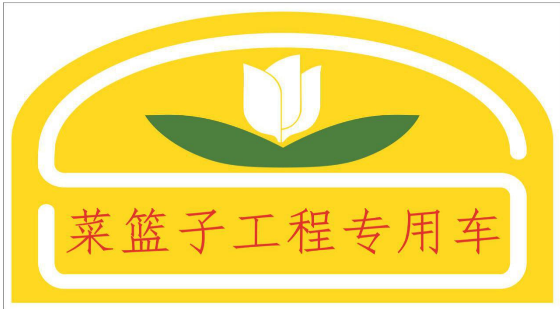
图 1 专用车标识图样