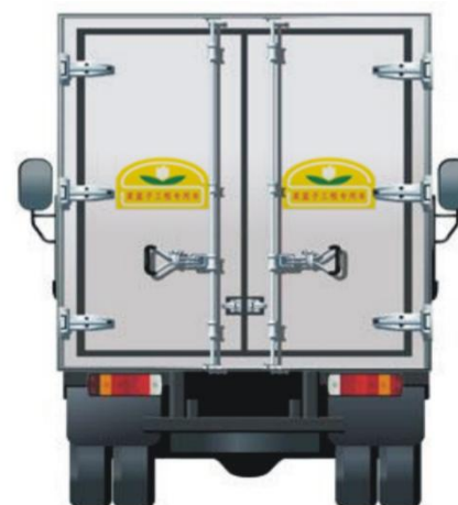
上海市菜篮子工程专用车外观制式涂装模拟效果图